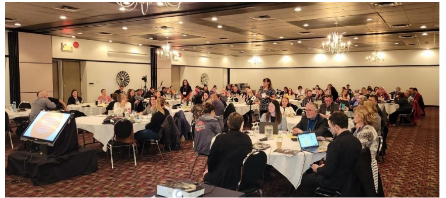
Représentants du secteur scolaire de la FEESP-CSN, réunis à Trois-Rivières